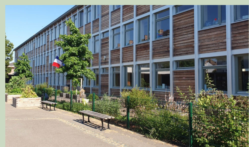
École Edouard Branly 2020