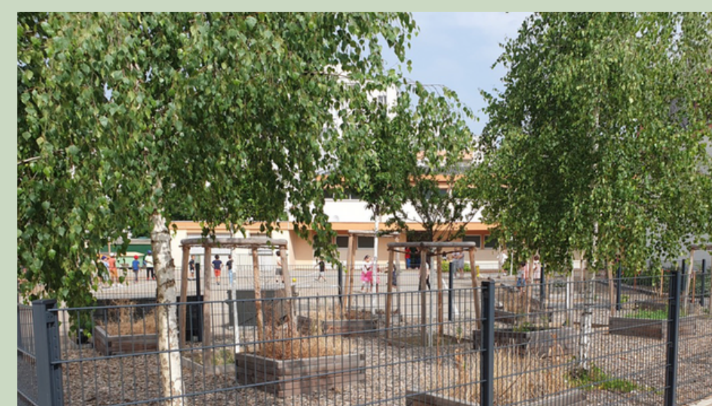
École Catherine 2021