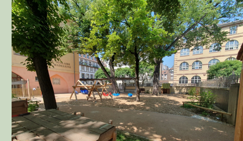
École Sainte Madeleine 2022