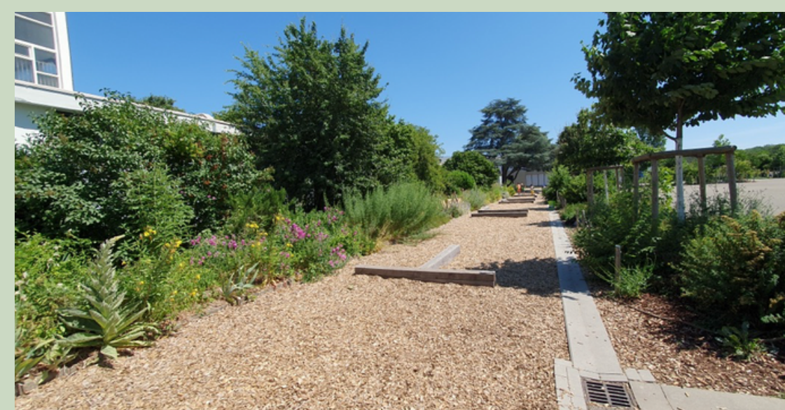
École Jean Fischart 2020