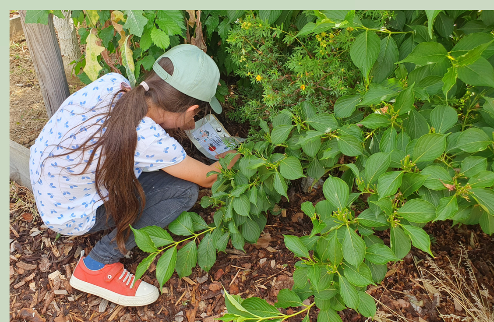
Pose de pièges par une élève de l'école Jean Fischart

exploiter ces aménagements pour le bénéfice des élèves : pratiquer la chasse à vue ou appliquer le protocole Jardibiodiv